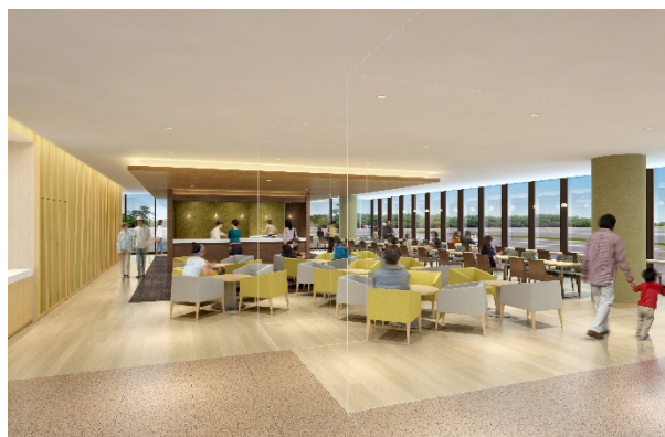
カフェラウンジ【イメージ】